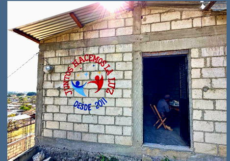
CLINICA EN CONTRUCCION OCOSINGO, CHIAPAS, 2023

consta de una red, de distintas clinicas, en distintas localidades donde brindamos nuestros servicios de salud y que son visitadas a travez de nuestro equipo medico, por tiempo indeterminado y en lapsos establecidos por la comunidad, ya sea mensuales, bimestrales o trimestrales. para de esta manera, lograr el control y seguimiento de todos nuestros pacientes. .